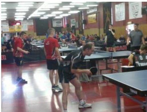
Sferbeeld vanuit de zaal ...