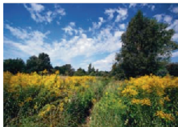
De Canadese guldenroede

Ook in de watersfeer maar iets helemaal anders is het wedervaren van de blauwbandgrondel. Deze kleine vissoort van een tiental centimeter lang, kent een echt succesverhaal. Je kunt er donder op zeggen dat hij in vele plassen en beken van de Rand aanwezig is, maar omdat er weinig systematische bemonsteringen zijn en omdat de soort nog niet zo lang in Vlaanderen aanwezig is, zijn de verspreidingsgegevens schaars. Toch is de soort zelfs al in de Zenne bovengehaald, maar dan wel stroomopwaarts van het Brussels Gewest. Hij komt voor in stromend en stilstaand water en hij heeft het grote voordeel over een enorm aanpassingsvermogen te beschikken. Daardoor overleeft hij in relatief vuil, zuurstofarm water en past hij zijn prooi aan naargelang het aanbod. Hij is het meest verlekkerd op heel kleine waterdiertjes, maar als die er niet zijn, kan hij probleemloos overschakelen op wieren, waterslakken en andere ongewervelden. Doorheen het jaar is de soort overwegend grijsachtig bruin van kleur, maar tijdens het voortplantingsseizoen krijgen de mannetjes een kenmerkende blauwe kleur. Daaraan