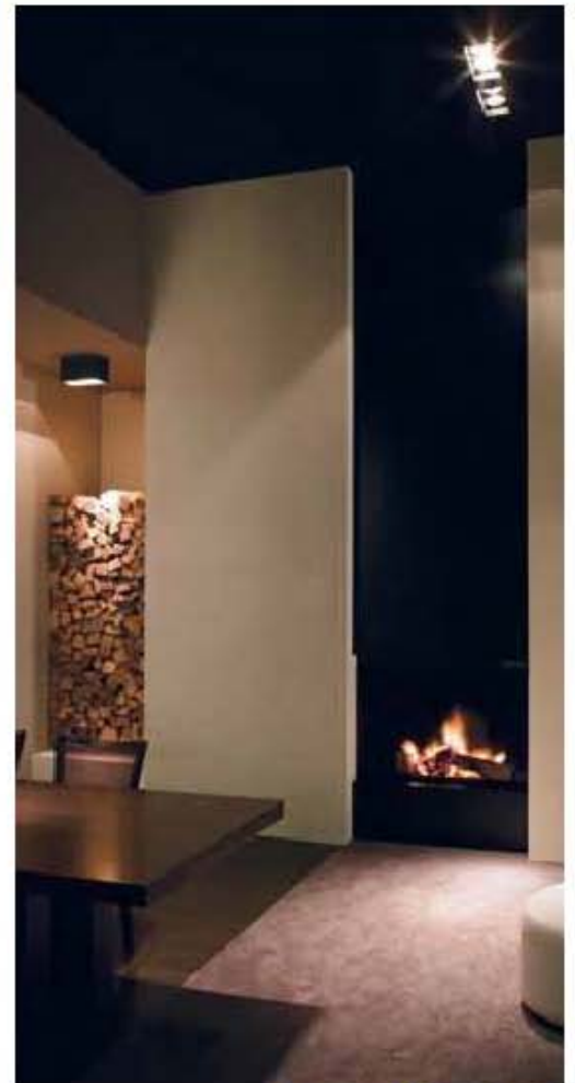
Renovator Firebox 900SS

Pieters: "Met gas heb je een grote kans tot CO-vergiftiging. Als er met biobrandstof gewerkt wordt, is de kans nihil. Wanneer het 98 procent ethanol bevat, is het zuiver."