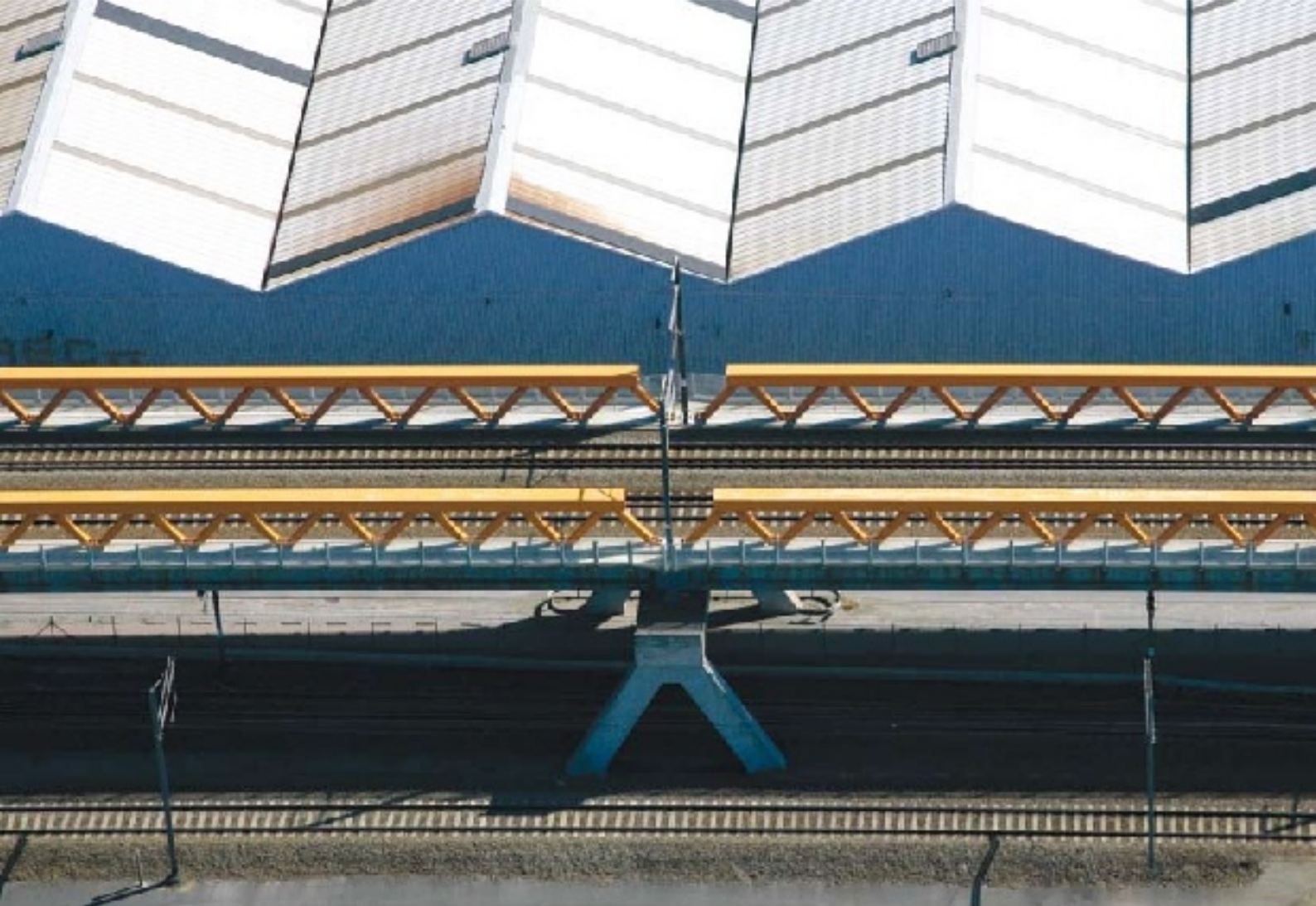
Het kanaal Rupel-Charleroi ter hoogte van Vilvoorde (L) en een spoorlijn met industriële hangars in Beersel worden vanuit de hoogte bijna abstracte kunstwerken.