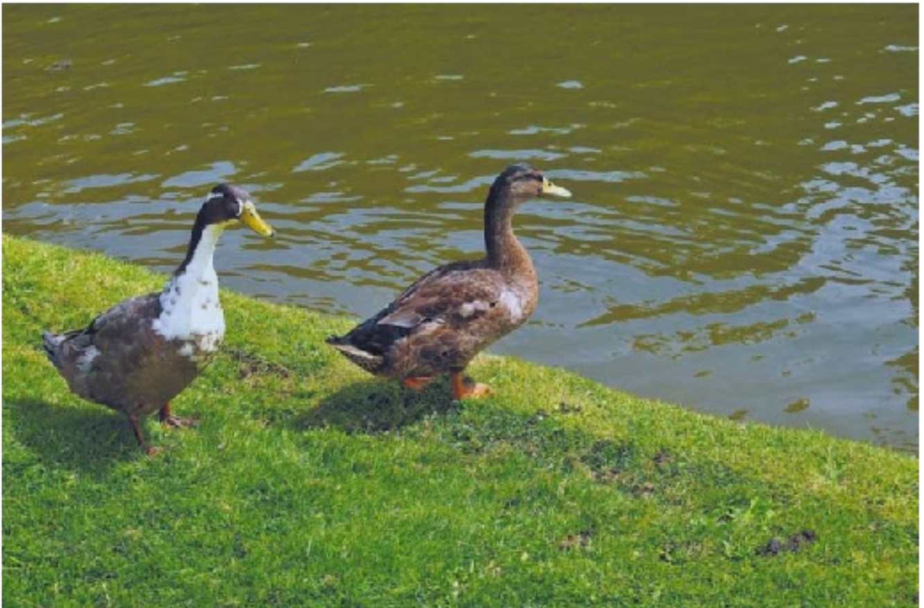
Een bastaard- of soepeend (l.) naast een min of meer 'gewoon' wijffe

vogel waarvan de initiële kenmerken steeds minder duidelijk zijn. Bij de mannetjes blijf je meestal een deel van de groene nek zien en de wat gekrulde middelste staartveren. Bij mannetjes en vrouwtjes zie je nog de met wit omzoomde paarse spiegels. Dat zijn smalle, rechthoekige vlakken in de middelste achterrand van de vleugels. Als ze neerzitten, kun je er meestal een glimp van opvangen, maar vooral in de vlucht is dit kenmerk goed te zien. Bij ver doorgedreven bastaardisering kan het verdwijnen en hou je dus een soort over die weinig of niets meer lijkt op de wilde vorm.