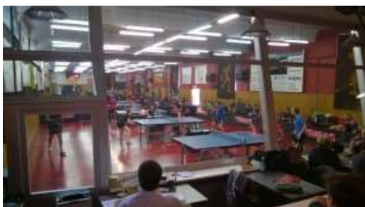
Sferbeeld van Daviscupcriterium 2015